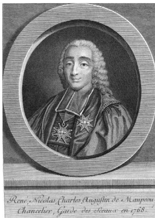
Рене Николя де Мопу. Гравюра XVIII в.

препона с их пути устранена, но... 10 мая 1774 года Людовик XV скоропостижно скончался от оспы.