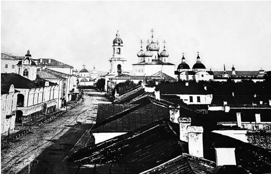
Миллионная улица в Твери. 1860 год. Тверь была прототипом губернского города в «Бесах»

внимательным. Единственная настоящая лакуна находится между восьмой и девятой главами: в этом месте, в самом центре романа, должна находиться глава «У Тихона», которую по цензурным соображениям отказался публиковать издатель «Русского вестника» Катков. В современных изданиях изъятая глава публикуется в виде приложения, в ней Николай Ставрогин исповедуется и фактически объясняет свое будущее самоубийство.