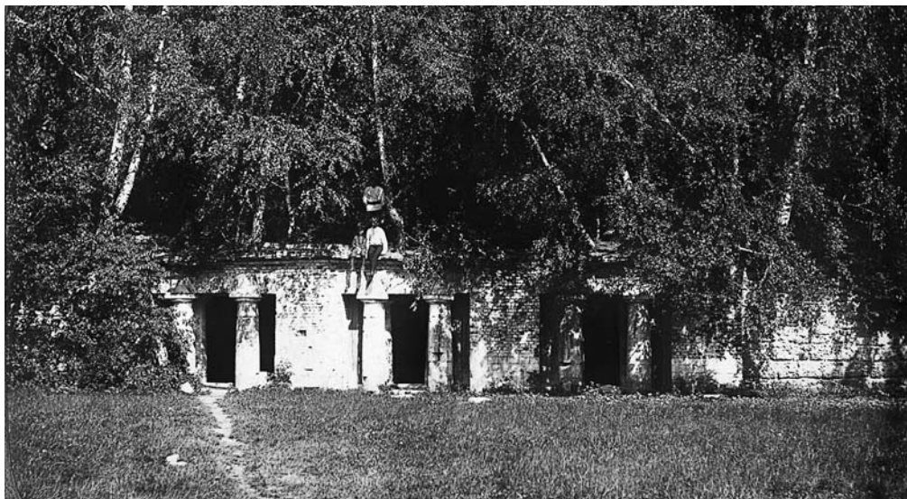
Грот в Петровско-Разумовском парке. 1910 год.

В одном из таких гротов произошло убийство студента Иванова соратниками по революционной организации «Народная расправа»