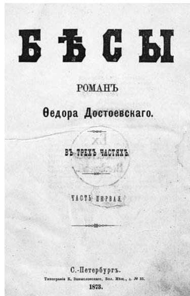
Обложка первого книжного издания «Бесов». 1873 год

Поскольку Достоевский и сам считал «Бесы» тенденциозной книгой («Хочется высказать несколько мыслей, хотя бы погибла при этом моя художественность», — пишет он Страхову 24 марта 1870-го) и написана она была как будто про «Народную расправу», неудивительно, что