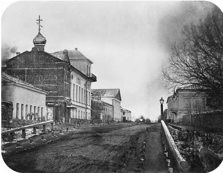
Здание пансиона Рязанской губернской гимназии. Из альбома «Рязань в фотографиях XIX — первой трети XX века». 1868–1869 годы. В 1858–1860 годах Щедрин служил вице-губернатором Рязанской губернии

усилить сатирический эффект и придать дополнительную «зыбкость», неконкретность статусу Глупова — «сборного города», представляющего всю Россию. Некоторые градоначальники у Щедрина демонстрируют вполне губернские, а то и царские замашки. А иные идут еще дальше: градоначальник Бородавкин втайне пишет устав «О нестеснении градоначальников законами», единственный пункт которого гласит: «Ежели чувствуешь, что закон полагает тебе препятствие, то, сняв оный со стола, положи под себя». Г. Иванов, комментируя это место, указывает на следующий рассказ Владимира Одоевского: «Губернатор Ховен присутствовал в губернском правлении (во время оно), и когда, в споре, показали ему Свод, он взял его и сел на него, говоря: ну, где же теперь ваш закон?» 22