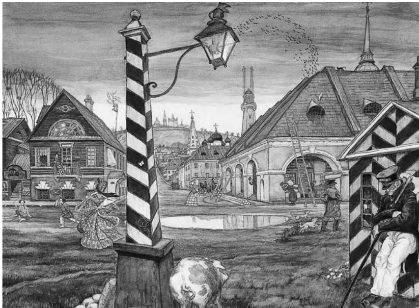
Мстислав Добужинский. Провинция 1830-х годов. 1907 год

«Историю одного города», говорил о проекте Бородавкина учредить воспитательный институт для градоначальников как о «приложении сатиры автора к настоящему положению вещей, а не к прошедшему времени» 25 . Так читали «Историю одного города» и советские комментаторы (закрывая глаза на сходства угрюм-бурчевского Глупова с современным им тоталитарным общественным устройством).