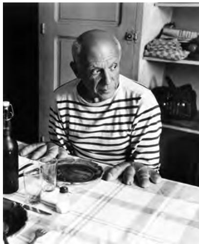
Робер Дуано. Хлеба Пикассо. 1952. Пикассо родился в Каталонии, но большую часть жизни провел во Франции

Национальное блюдо «бифштекс с картошкой фри» ( biftek et frites ) наполовину носит английское название, а картофель и вовсе родом из Америки. Классический французский завтрак — кофе с молоком и круассаны — тоже интернациональная мозаика: круассаны позаимствованы у австрийской выпечки, кофе попал во Францию из Турции, а затем (вместе с сахаром) — с Карибских островов, молоко же в основном дают голштино-фризские коровы.