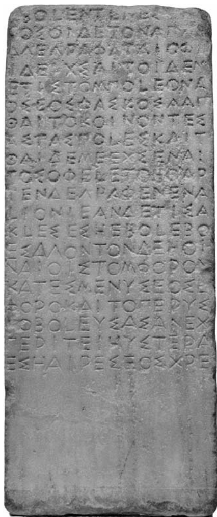
Илл. 1.1. Надписи на камне вроде этой, относящейся к V в. до н. э. и сообщающей о финансовых делах Афинского морского союза, являются первоисточниками по истории Древней Греции. В те времена греки записывали подобные документы только заглавными буквами без пробелов между словами