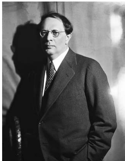
«Детство» Льва Толстого повлияло и на «Детство Никиты», которое написал однофамилец писателя — Алексей Толстой

соответствующим образом, но не показывал «психический процесс». Толстой же сосредотачивается именно на том, как меняются эмоции и мысли героя, формируя его личность прямо на наших глазах. В дискуссиях 1850–1860-х годов обсуждалось, каким образом «лишние» люди могут стать «новыми» людьми, способными к активному созиданию. Толстой показывает тот период формирования человека, когда эти перемены запрограммировать легче всего.