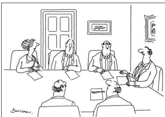
2. «Отличное предложение, мисс Триггс» — карикатура Райаны Данкан, изображающая сексистскую атмосферу производственного совещания. Punch, 8 September 1988.