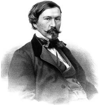
Александр Дружинин. 1850-е годы