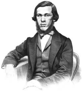
Николай Добролюбов. 1860-е годы