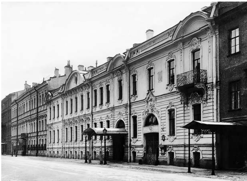
Дом №3 по Моховой улице, где Гончаров жил с 1857 года до своей смерти 15 сентября 1891 года. Санкт-Петербург, 1914 год

это своего рода концентрат, объясняющий всплеск и «погасание» жизни Обломова. Заданный этим сном ритм и становится организующим началом романа, который развивается вовсе не по социальным законам, а согласно годичному природному циклу: выйдя из зимней спячки, весной Обломов встречает Ольгу, их отношения переживают летний расцвет и умирают осенью. Причиной окончания романа становится невозможность переправиться через замерзающую на зиму Неву.