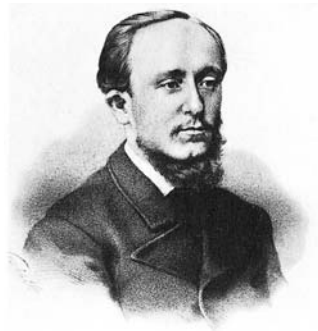
Дмитрий Писарев. 1880-е годы